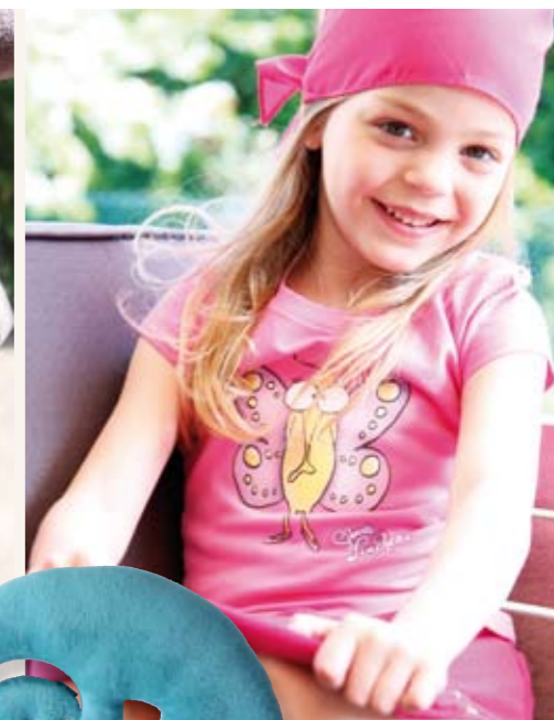
Individuelle Mode und einzigartige Kuschelfreunde werden im hauseigenen Atelier in sorgfältiger Handarbeit hergestellt