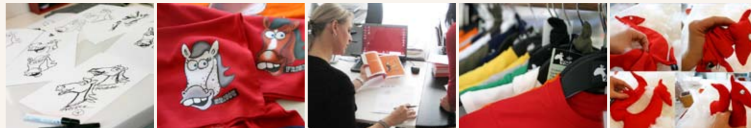
Von der Skizze bis hin zum fertigen Produkt

„Der Kreativität sind keine Grenzen mehr gesetzt.“